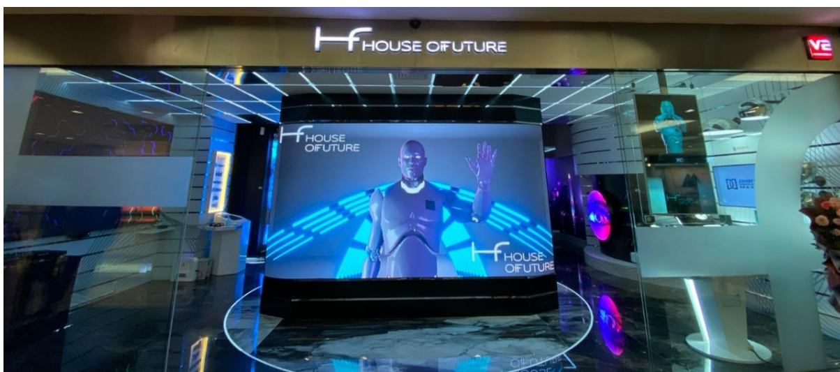
Presentation Zone at the House of Future with an out-of-the-box display and supported by systematic control technology.

Jakarta, 17 June 2022 - V2 Indonesia, a subsidiary of PT M Cash Integrasi Tbk (IDX: MCAS), is a company focusing on high-tech audio-visual solutions. It presents a new experience of enjoying the latest technologies through the House of Future (HoF). Located at Plaza Indonesia, Level 3, HoF is an Experience Creative Gallery Store for all technology needs, from audio-visual to future technologies (IoT, AI, VR, XR, AR, Metaverse & Robotics), which can be implemented for users starting from consumers households to corporations.