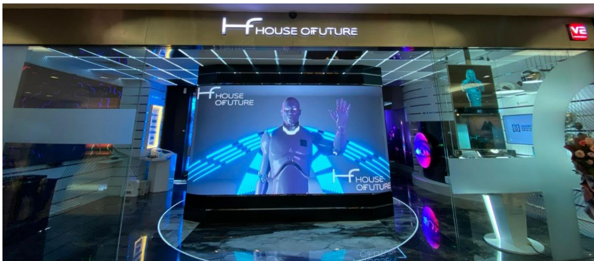
Presentation Zone dalam House of Future dengan tampilan yang out of the box dan didukung pengaturan teknologi yang sistematis.

Jakarta, 17 Juni 2022 - V2 Indonesia, anak perusahaan PT M Cash Integrasi Tbk (IDX: MCAS), adalah perusahaan yang berfokus pada solusi audio visual berteknologi tinggi, Ini menghadirkan pengalaman baru menikmati teknologi terkini melalui House of Future (HoF). Berlokasi di Plaza Indonesia, Level 3, HoF adalah Experience Creative Gallery Store untuk semua kebutuhan teknologi, mulai dari audio-visual hingga teknologi masa depan (IoT, AI, VR, XR, AR, Metaverse & Robotics), yang dapat diimplementasikan untuk pengguna mulai dari konsumen rumah tangga hingga korporasi.