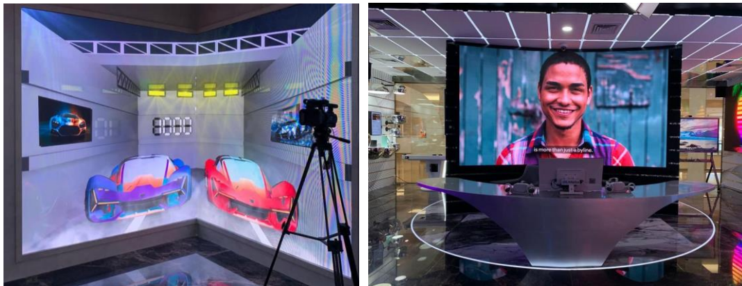
Display of Technology Lounge and Command Center at the House of Future (from left to right).

Furthermore, other technology rooms located at HoF include the Retail Area , a particular room that displays modern advertising differently. The technology in this room is supported by IoT (Internet of Things), RFID sensor digital signage and Spark AR from Meta to display Augmented Reality images in motions.